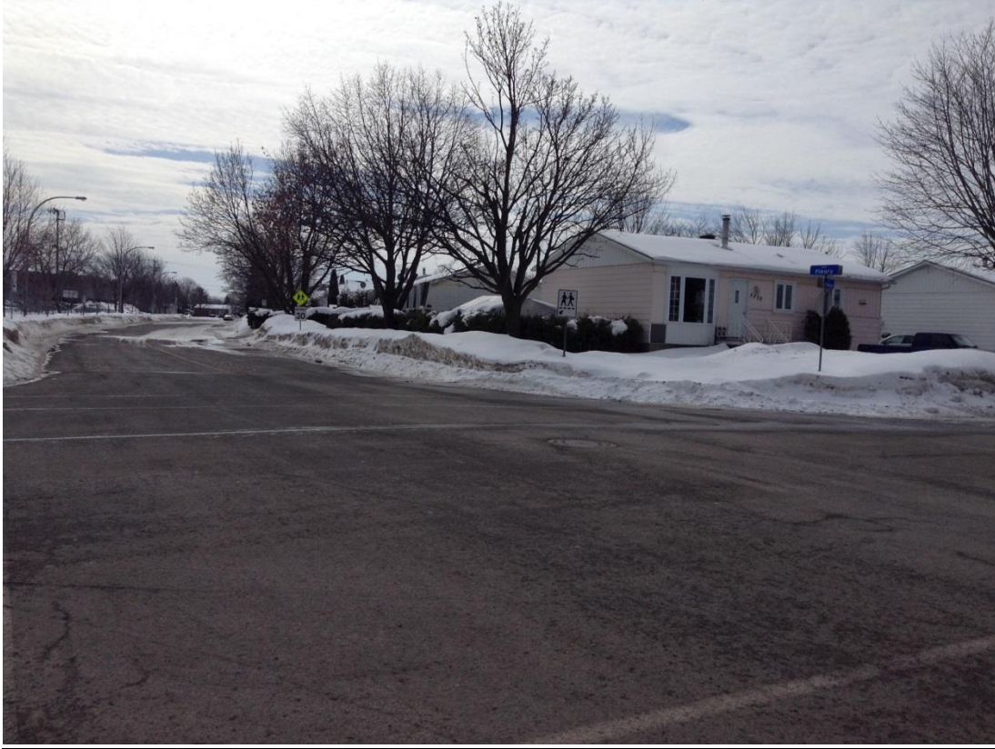
Intersection rue Fleury et rue Caroline