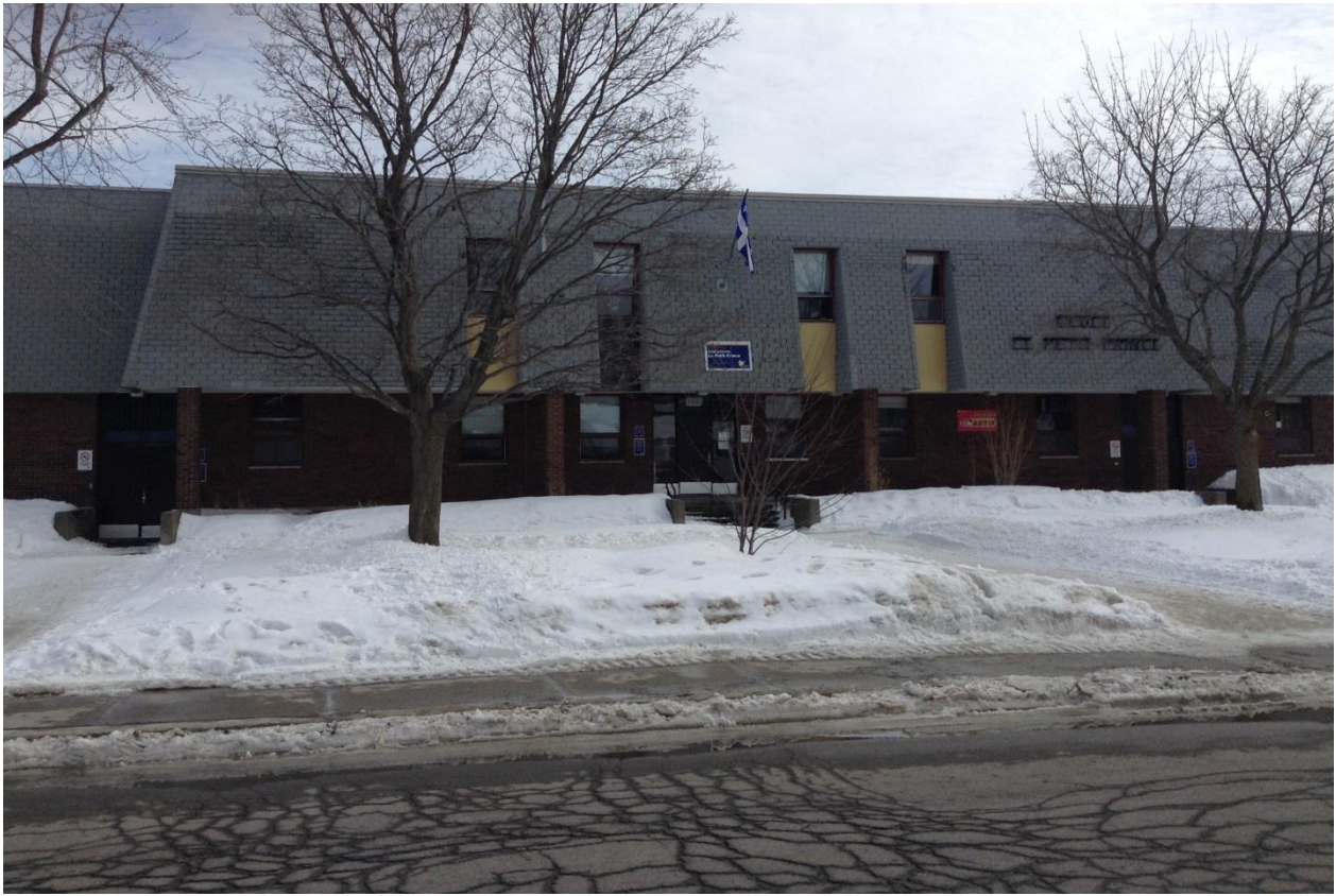
E. École Le Petit-Prince